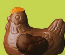
Duo praliné et ganache caramel