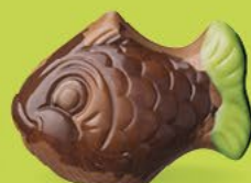
Praliné et noix de coco caramélisée