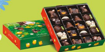
LE BALLOTIN DE 250 G NET 20 CHOCOLATS ASSORTIS