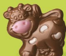
Praliné croustillant aux éclats de crêpe dentelle