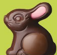
Praliné et éclats d'amandes caramélisées

Un lapin ou une poule, un canard ou un poisson, tout est permis quand on laisse libre cours à la gourmandise !