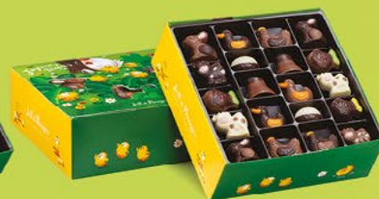
LE BALLOTIN DE 500 G NET 40 CHOCOLATS ASSORTIS