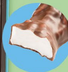
Un cœur tendre en guimauve enrobé de chocolat au lait

LA BOITE DE 28 LAPINS EN GUIMAUVE ENROBÉS DE CHOCOLAT AU LAIT** - 280 G NET