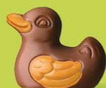
Praliné avec sucre pétillant