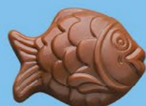
Chocolat au lait 36% de cacao