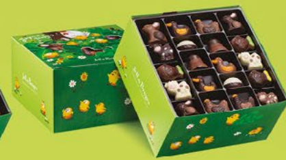
LE BALLOTIN DE 750 G NET 60 CHOCOLATS ASSORTIS