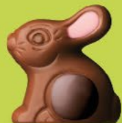
Praliné et riz soufflé