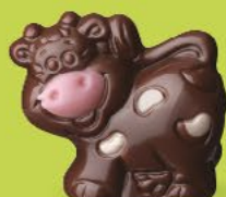
Praliné avec sucre pétillant