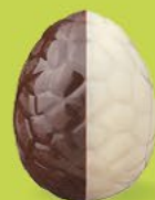
Praliné avec éclats de noisettes