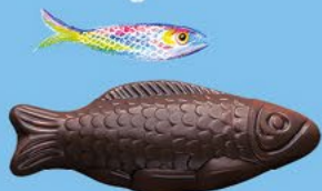
Chocolat noir 70% de cacao

LA BOITE DE FRITURES ASSORTIES - 220 G NET